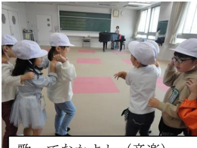
歌ってなかよし（音楽）