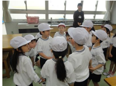
数カードを使って（算数）