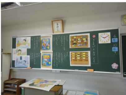
気持ちがいいのは（道徳）