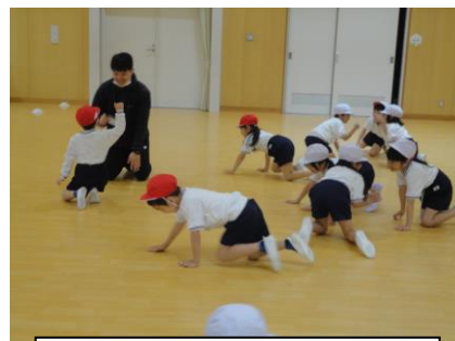
体づくり遊び（体育）