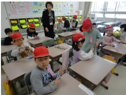
新聞紙でつくろう（図工）