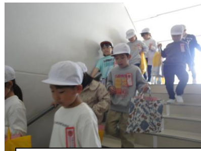
学校たんけん（生活）