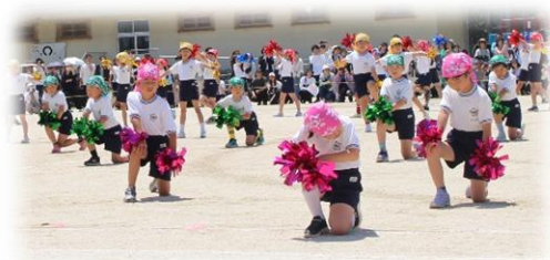
【2年】 ダンスの呼吸 弐の型 蜂の舞