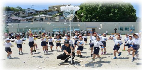
【1年】 やってみよう！玉入れ