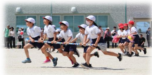
【3年】 THE FIRST typhoon