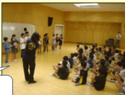
頑張った実行委員に拍手！ 【4年生】

6月には、水泳が始まります。蒸し暑い日が続くことだと思います。体調を整え、元気に暑い日乗り越えてほしいと思います。